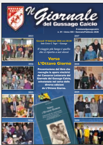
In copertina: Gli ospiti delle varie edizioni del nostro Concorso Letterario