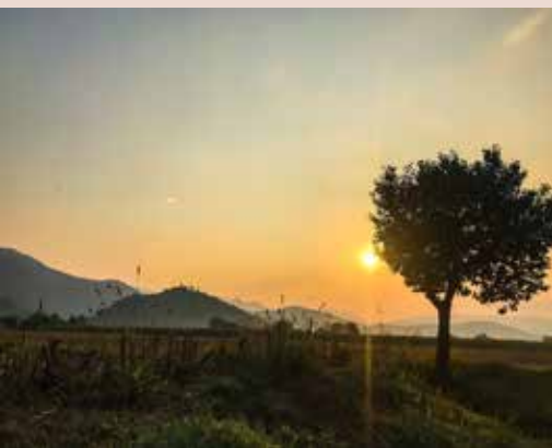
Settembre 2018 - Alba su Gussago dalla pista ciclabile Paratico-Iseo