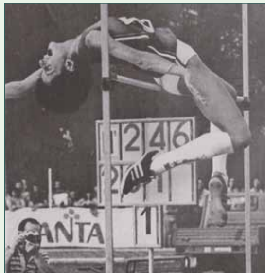
Il record mondiale di 2,01 m stabilito a Brescia nel 1978.