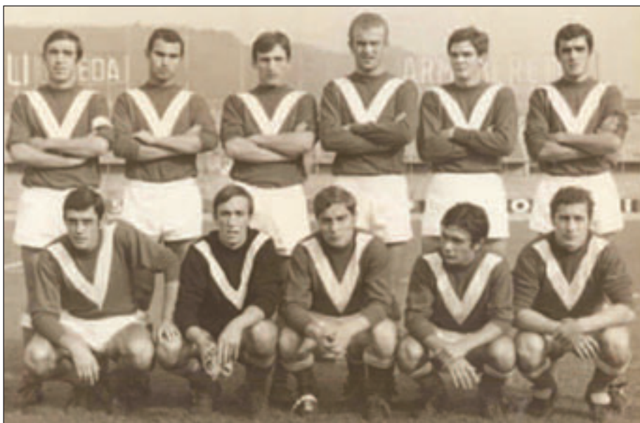
Riconoscete Gigi Cagni? Era il 1970 e vestiva la maglia del Brescia Calcio

R. Continuare ad allenare nel modo in cui credo; amo il mio lavoro e per me è importante poterlo fare sempre come intendo io.