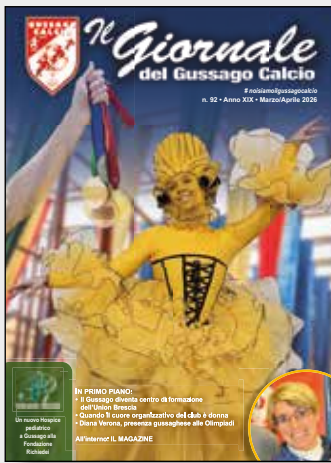
In copertina: Diana Verona all'apertura delle Olimpiadi Milano-Cortina 2026