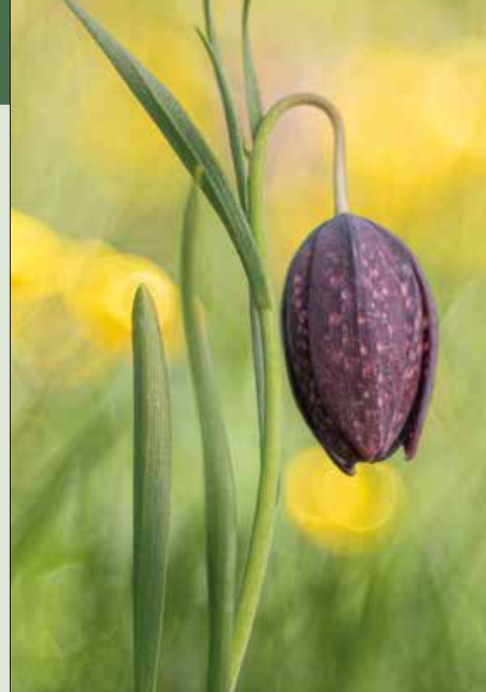
Nelle foto - sopra: Fritillaria tubaeformis Sotto: Campanula elatinoidea altri due fiori totalmente protetti