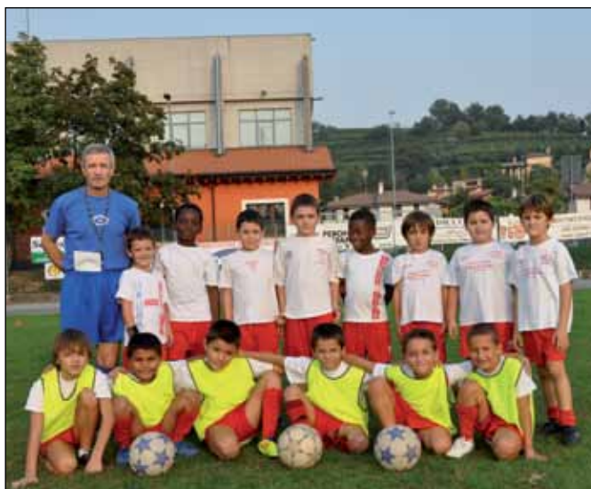
Pulcini - Scuola Calcio 2004