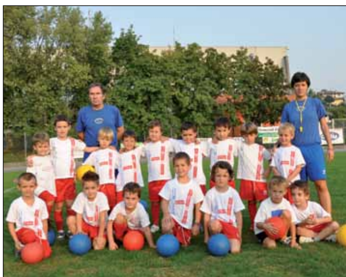
Primi Calci 2005-2006