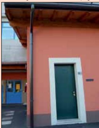
n. 17 - Anno IV - Settembre/Ottobre 2011 Copia gratuita