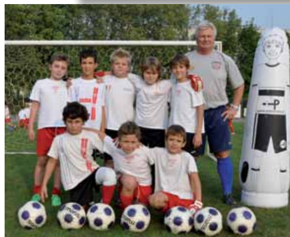
I portieri del settore giovanile