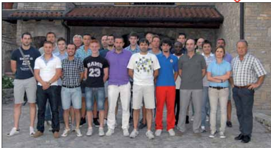
La nuova "rosa" della prima squadra.