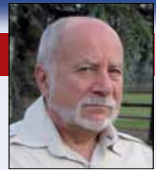
di Adriano Piacentini