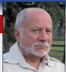
di Adriano Piacentini