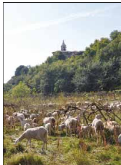
Un gregge di pecore al pascolo sotto la collina di Sale di Gussago: sembra una foto d'altri tempi...