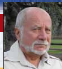
di Adriano Piacentini

"Giorno della Memoria", al fine di ricordare la Shoah (sterminio del popolo ebraico), le leggi razziali, la persecuzione italiana dei cittadini ebrei, gli italiani che hanno subito la deportazione, la prigionia, la morte, nonché coloro che, anche in campi e schieramenti diversi, si sono opposti al progetto di sterminio, ed a rischio della propria vita hanno salvato altre vite e protetto i perseguitati. (Legge 20 luglio 2000, n. 211).