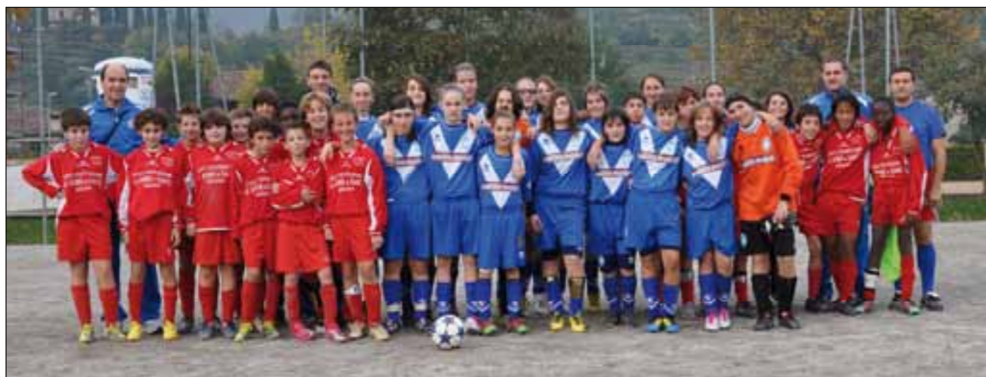
30 Ottobre 2010: amichevole di lusso per i nostri Esordienti con la squadra femminile Giovanissimi del Brescia