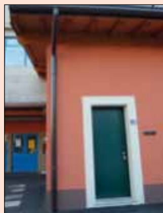
n. 13 - Anno III - Novembre/Dicembre 2010 Copia gratuita